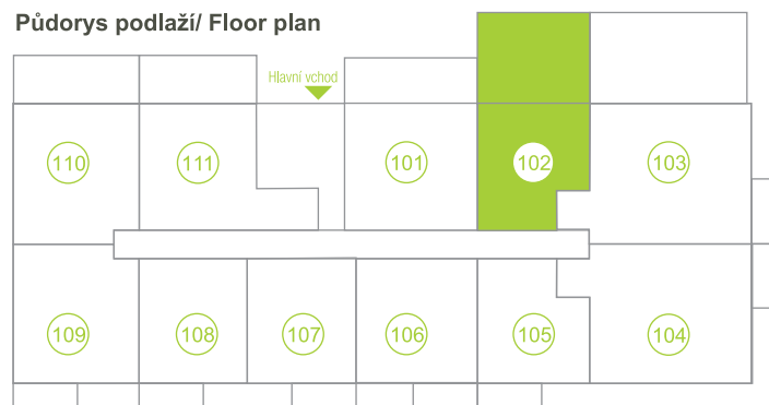
Půdorys podlaží / Floor plan