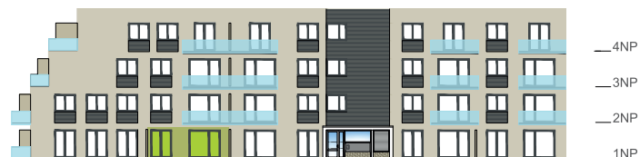
Západní pohled na dům / Building View - west side